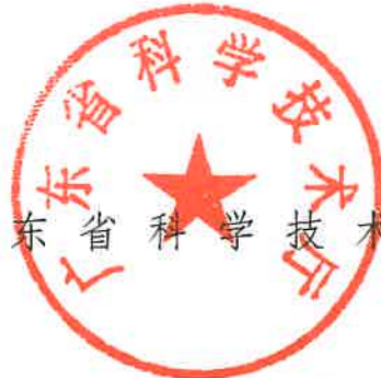
广东省科学技术厅