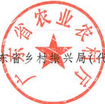
广东省乡村振兴局(代章)