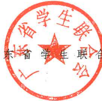
广东省学生联合会