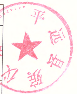
平远县殡葬选择性服务价格项目和标准 (表二)