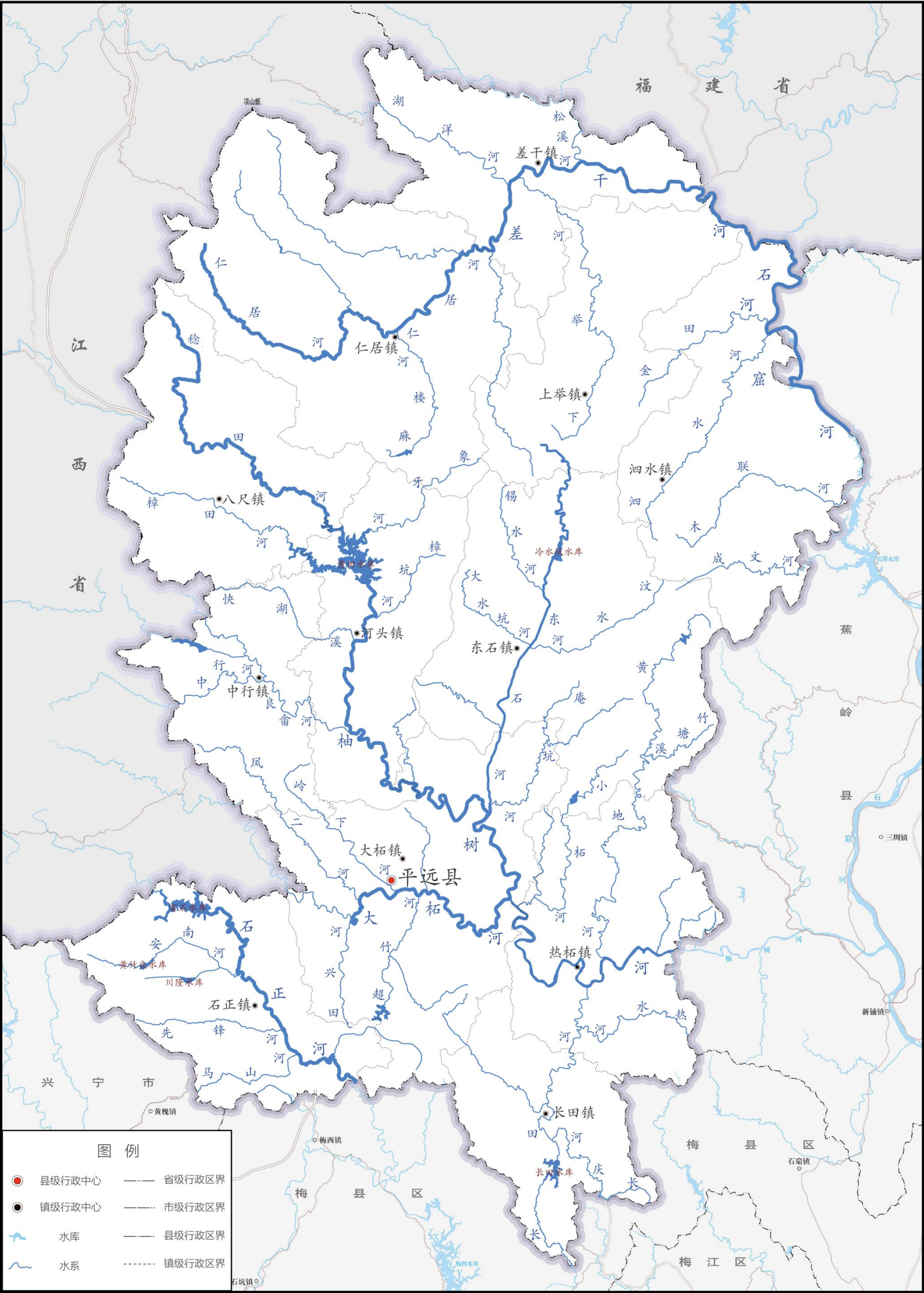
附图 1 平远县水系图